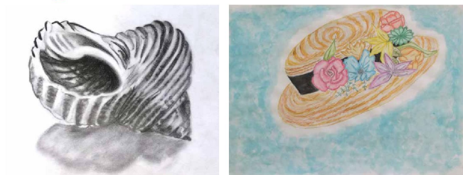
Exposició dels alumnes de Visual i Plàstica de 4rt. d'ESO de l'Institut de Llaveneres